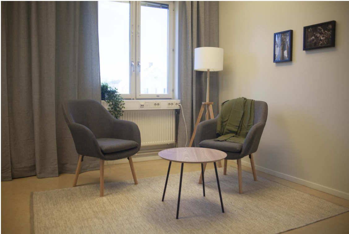
Rummet hyrs ut möblerat.