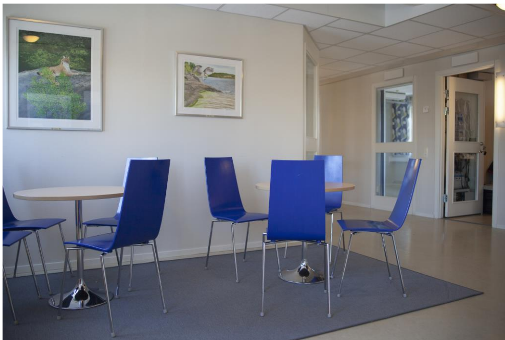
Gemensamma utrymmen i kontorsgemenskapen.