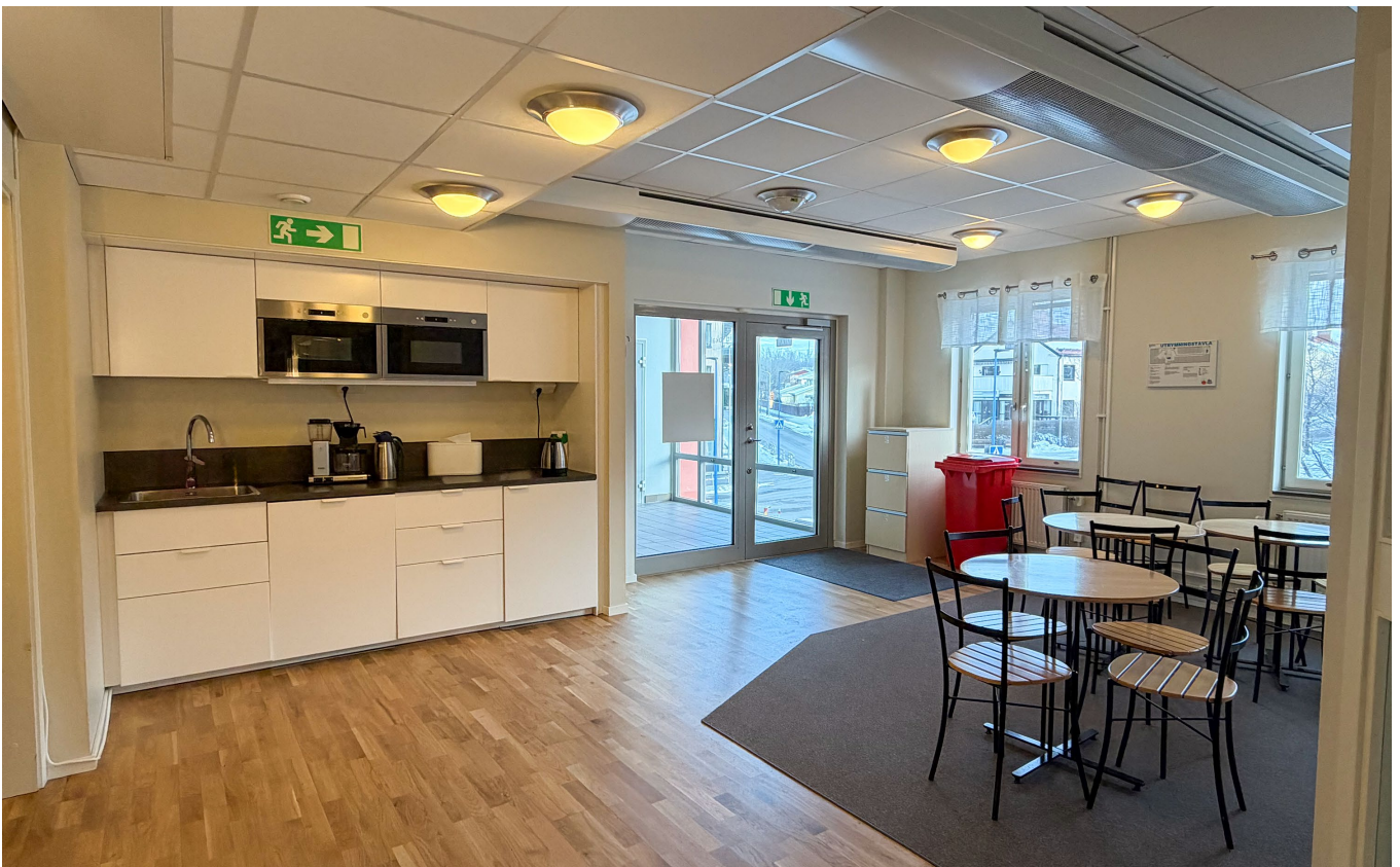
Kontorsrum, konferensrum och pentry.