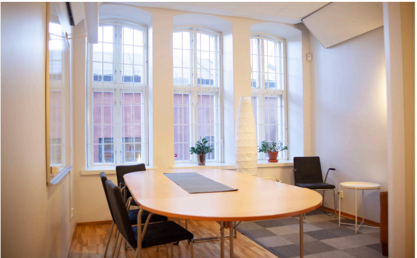
Kontorsrummet, pentry och konferensrum.