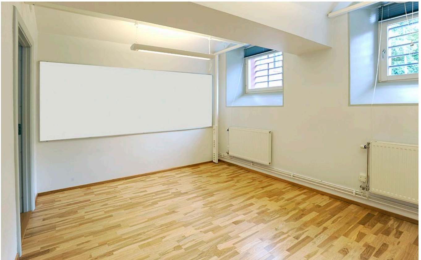
Lounge, konferensrum och kontorsrummet.