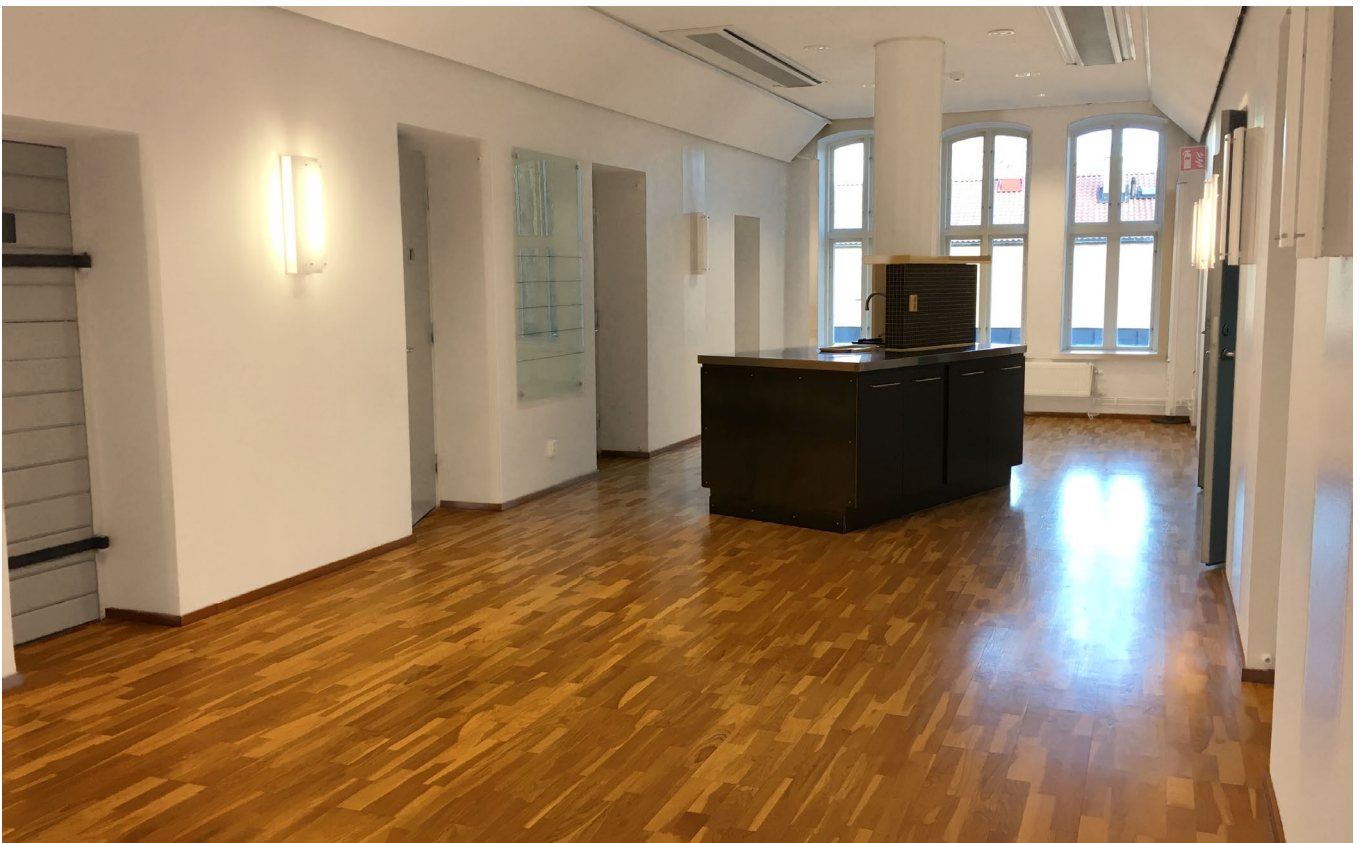
Kontorsrum, passage och pentry.