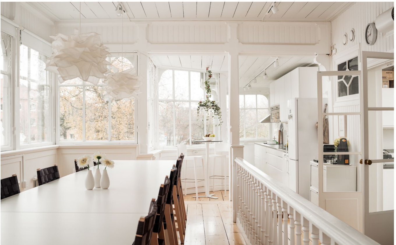
Badrum i marmor. Härligt kök i glasverandan.