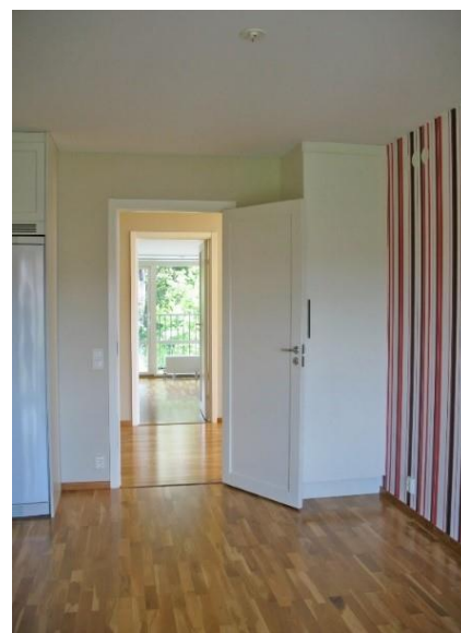
Kök med balkong.