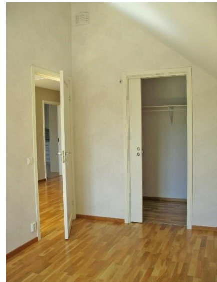
Vardagsrum och sovrum.